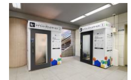
ワークブース 外観