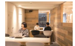
room EXPLACE 内観