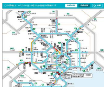
7/26 16:25 状況